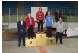
Športne igre invalidov 2019