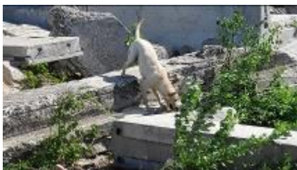
Trening v Tritolu, maj 2019

znanje jim je prišlo še kako prav, ko so iskali pogrešanega radioamaterskega tekmovalca ARDF na Klopnem vrhu.