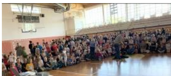
Predstavitve za 450 otrok OŠ Benedikt, oktober 2019

Največje predstavitve v 2019 so bile: Dan mobilnosti invalidov v okviru Evropskega tedna mobilnosti v Mariboru, Dan prostovoljstva v Mariboru, Predstavitve na festivalu Lent, Festival Lupa Ljubljana, Ruška nedelja v Rušah, delavnica V sozvočju s samim seboj, Projektni dan na OŠ Ptuj in OŠ Benedikt, Festival drugačnosti v Slovenj Gradcu, v Doživljajskem parku Betnava, predstavitev za Društvo invalidov ter Svet za invalide občine Slovenska Bistrica in številne druge.