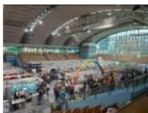
Karierni sejem 2019

Na sejmu je sodeloval tudi Svet invalidov Mestne občine Maribor in vključena invalidska društva.