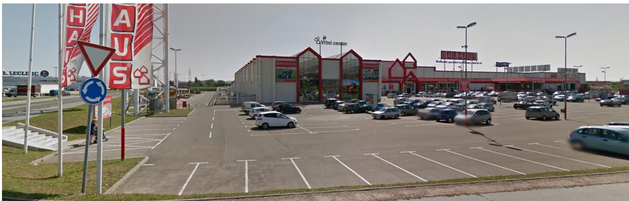
Pogled na območje z zahodne strani

Območje načrtovanja leži v južnem delu mesta Maribor, med Tržaško cesto na zahodu in železniško progo E 67 Šentilj-Maribor–Zidani most na vzhodu, v širšem pasu ob Cesti na Ledine. Na obravnavanem območju je zgrajen trgovski objekt Bauhaus